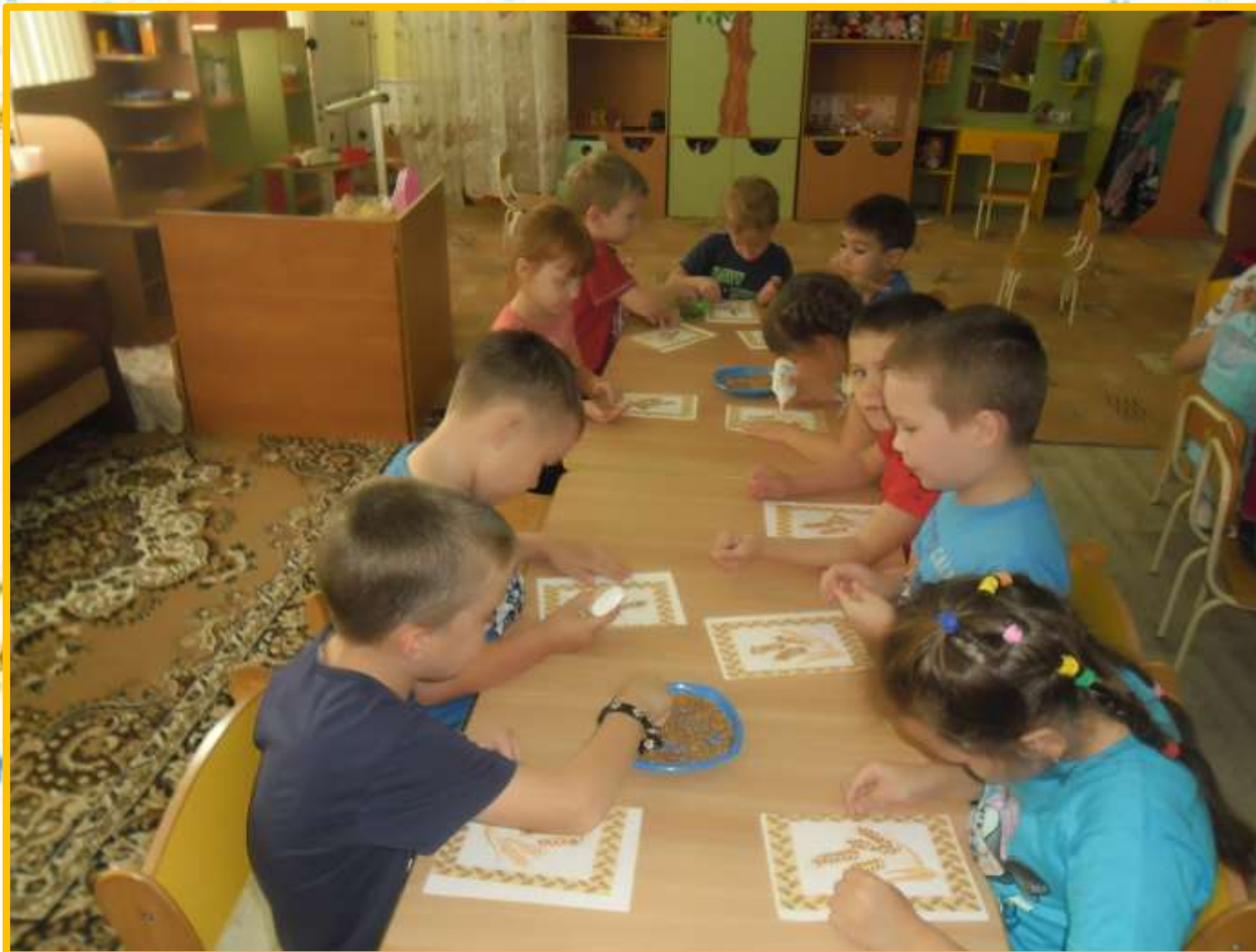
Апликация из пшеницы