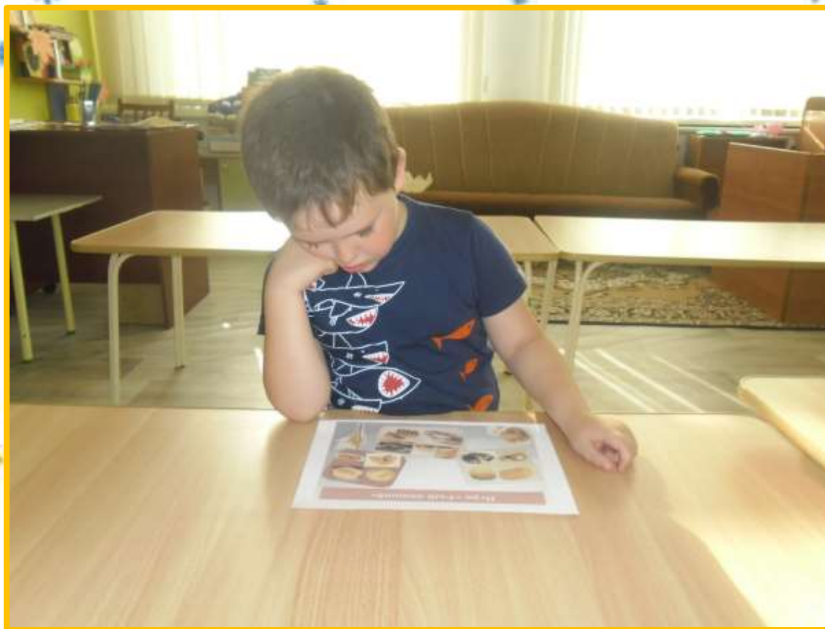
Д/и «Четвёртый лишний»