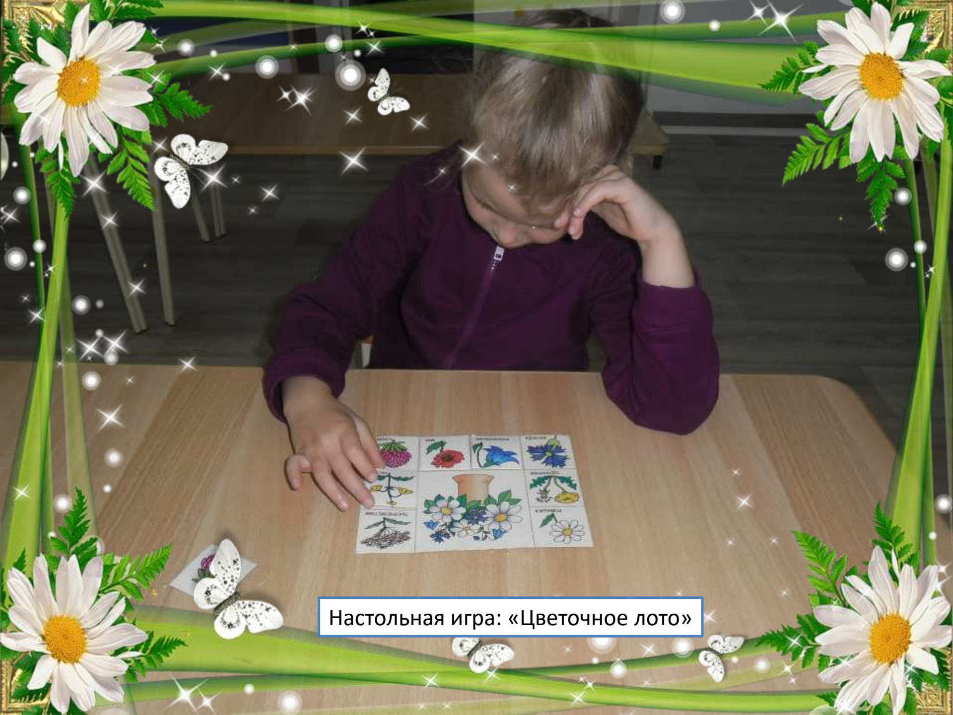
Настольная игра: «Цветочное лото»