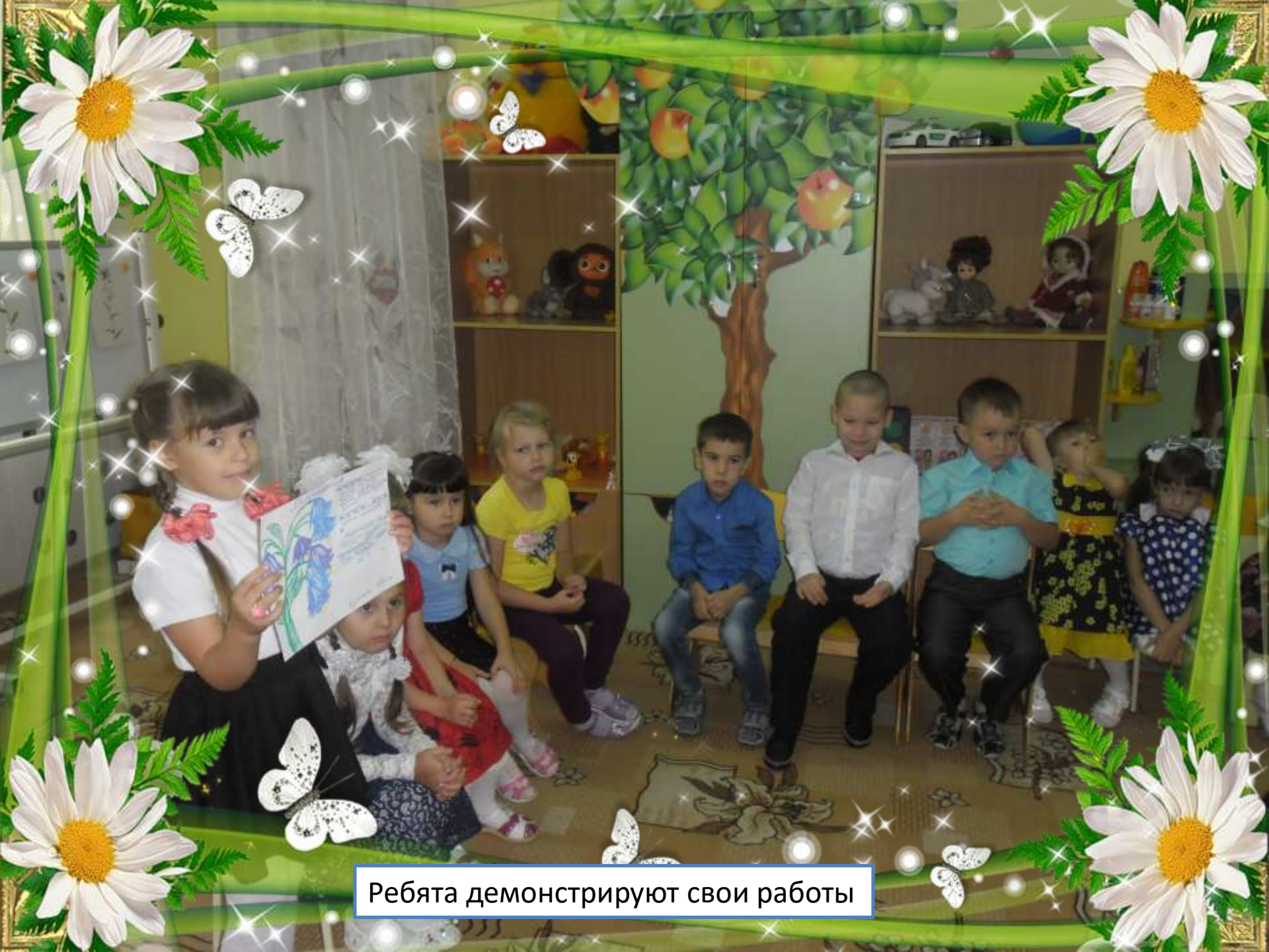
Ребята демонстрируют свои работы