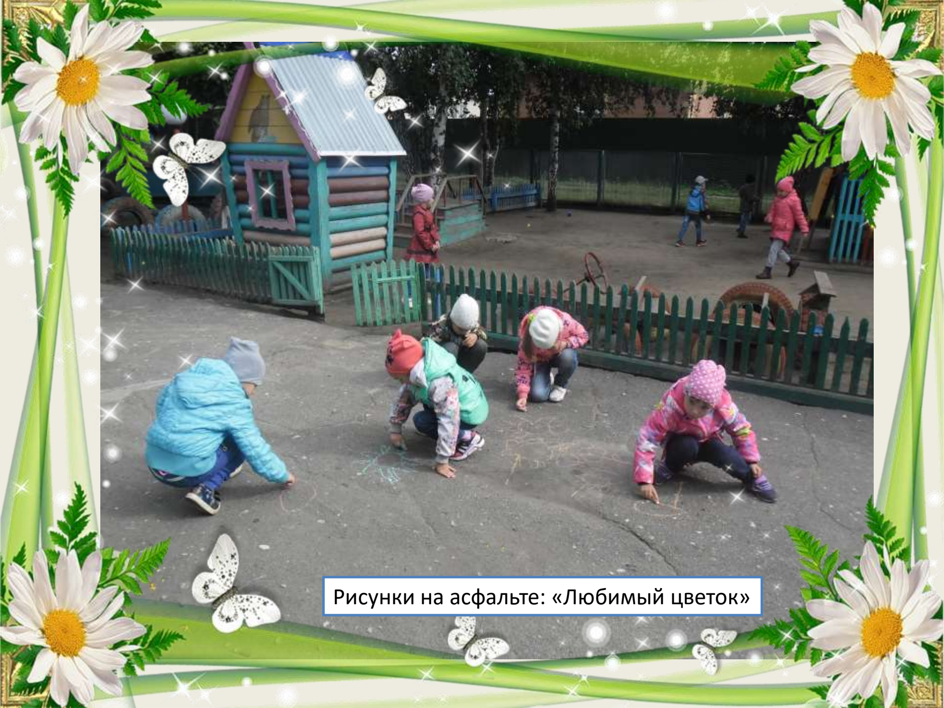
Рисунки на асфальте: «Любимый цветок»