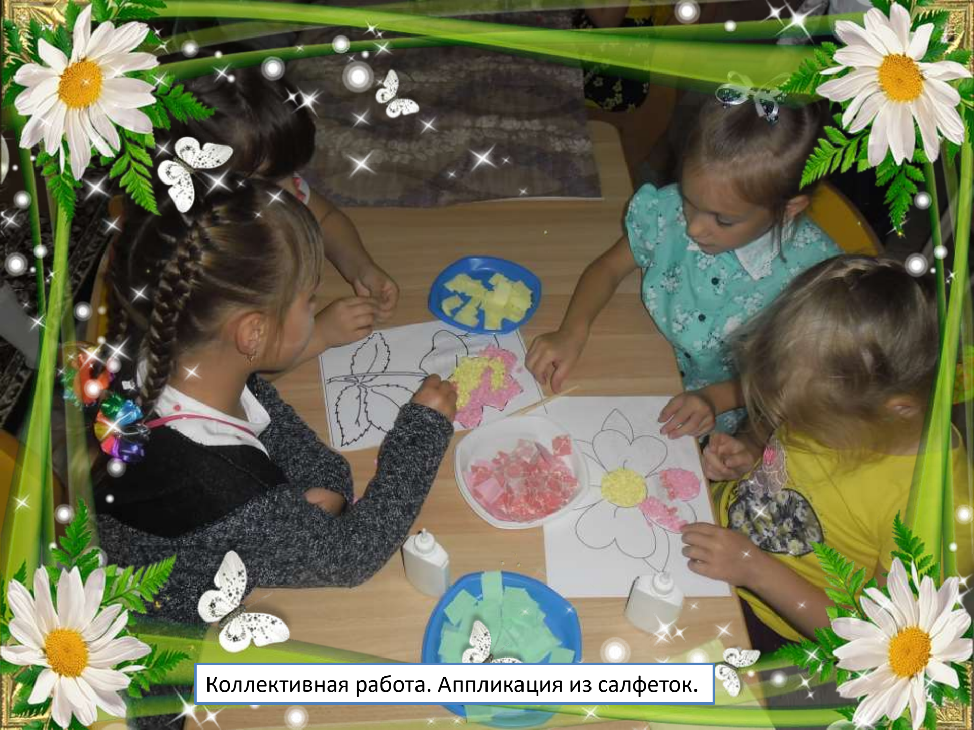
Коллективная работа. Аппликация из салфеток.