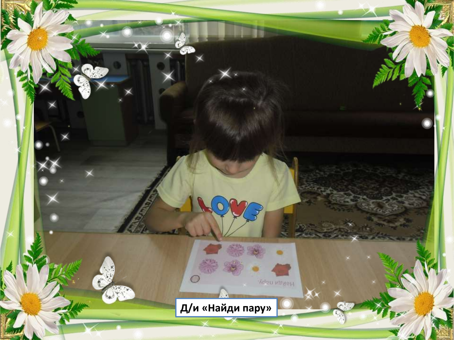
Д/и «Найди пару»