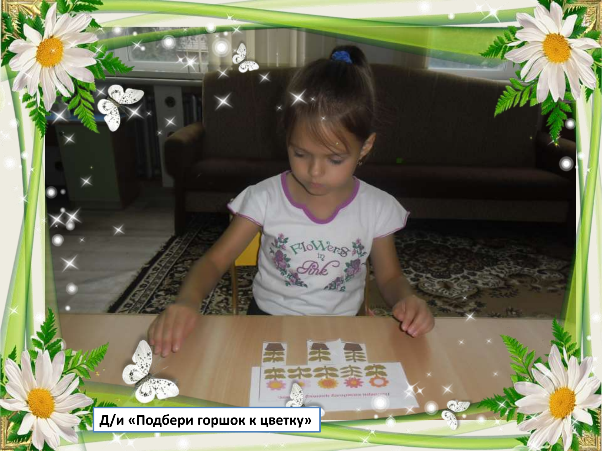
Д/и «Подбери горшок к цветку»