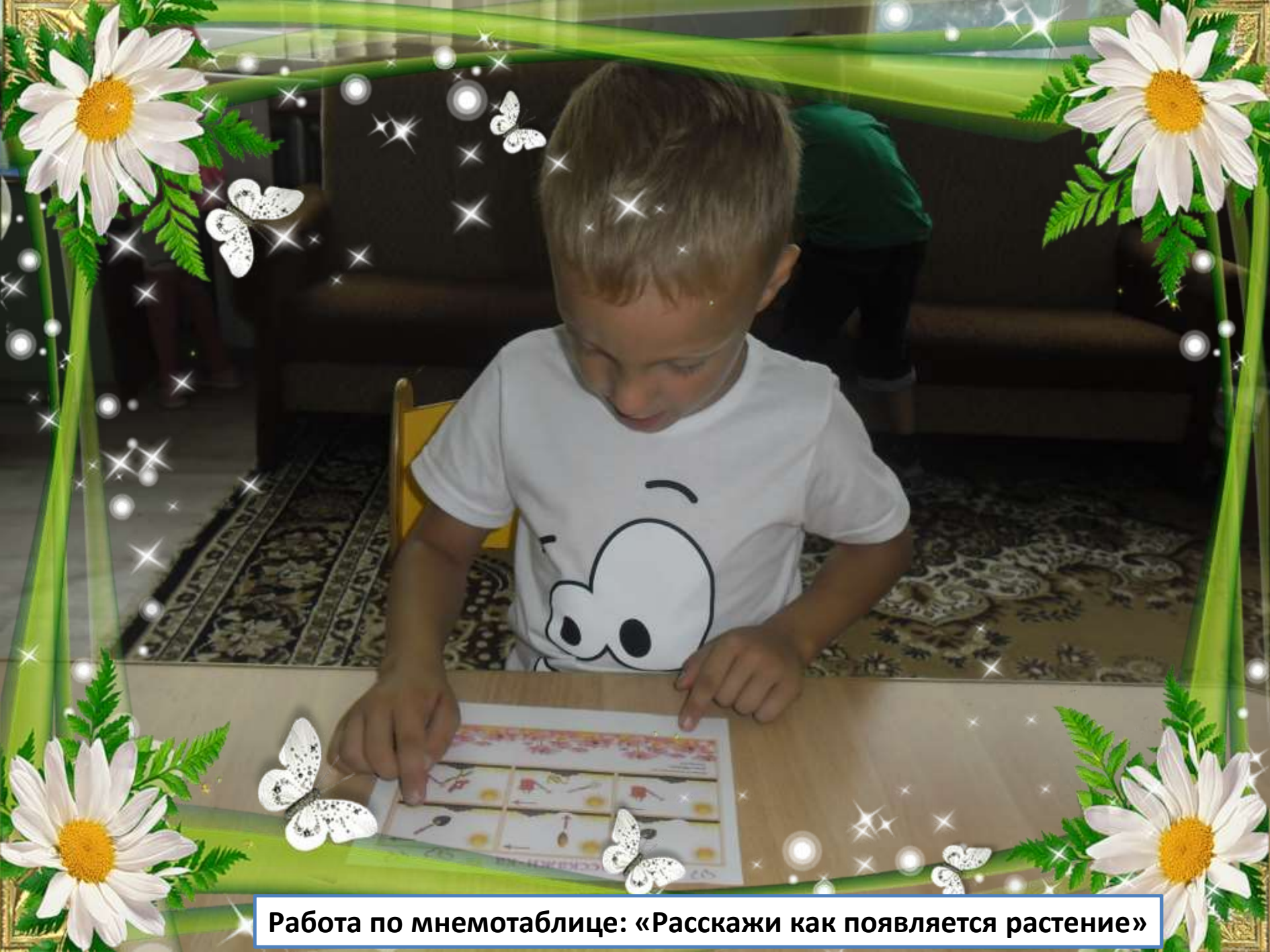
Работа по мнемотаблице: «Расскажи как появляется растение»