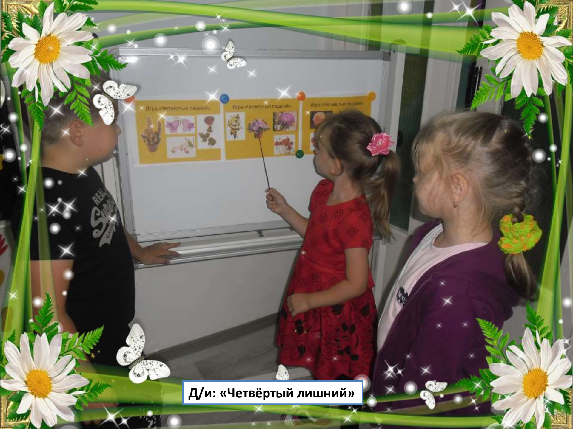
Д/и: «Четвёртый лишний»