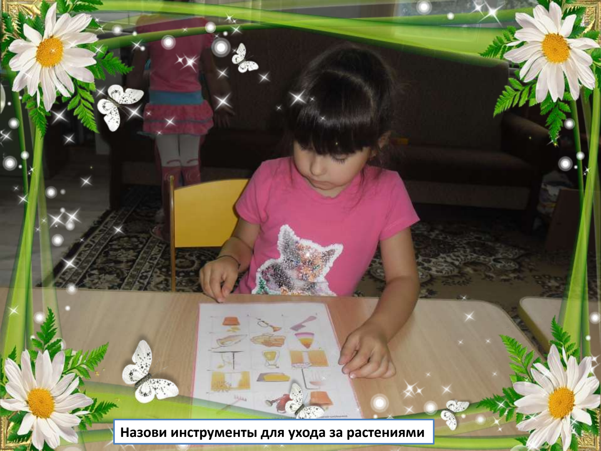
Назови инструменты для ухода за растениями