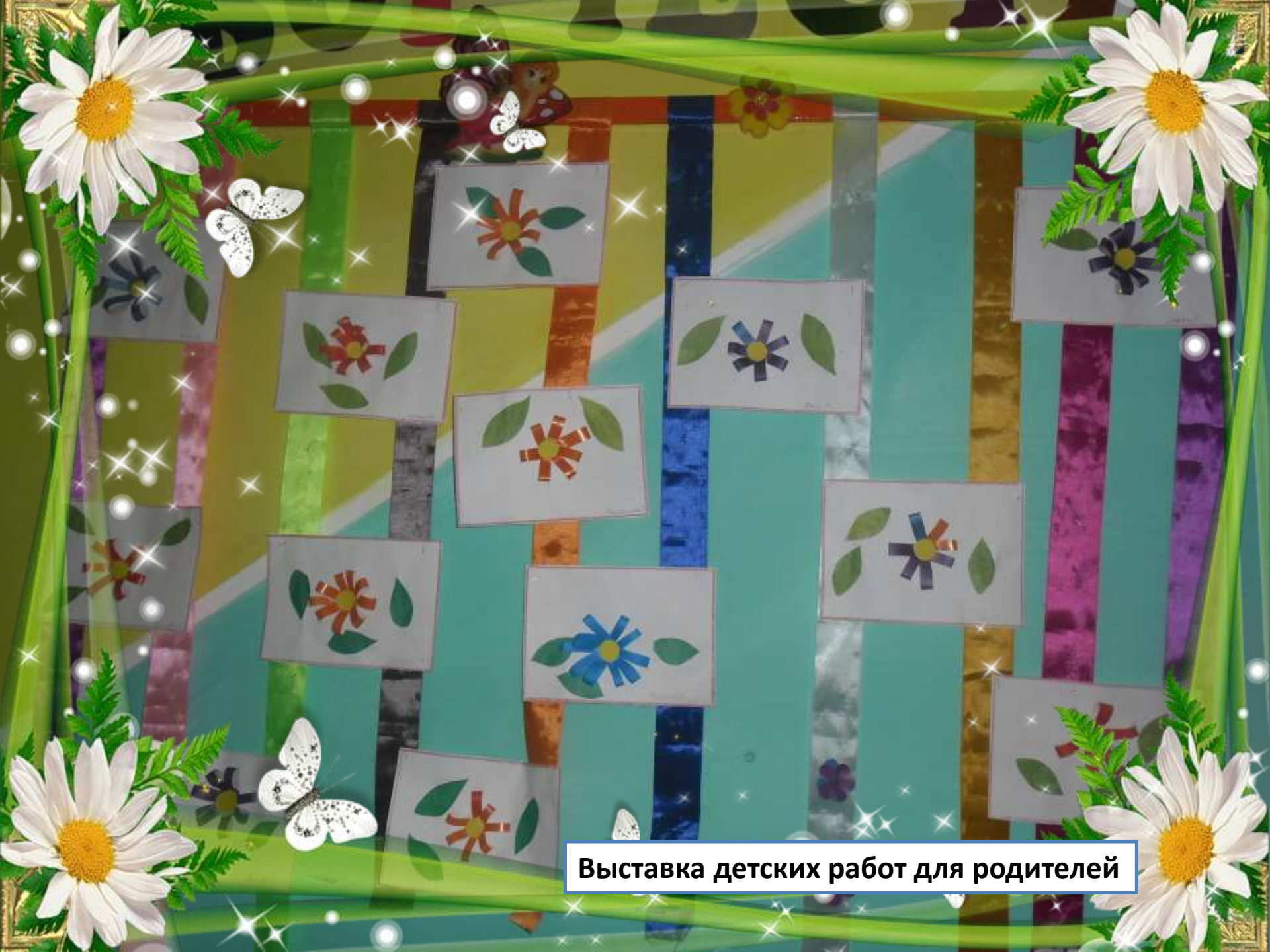
Выставка детских работ для родителей