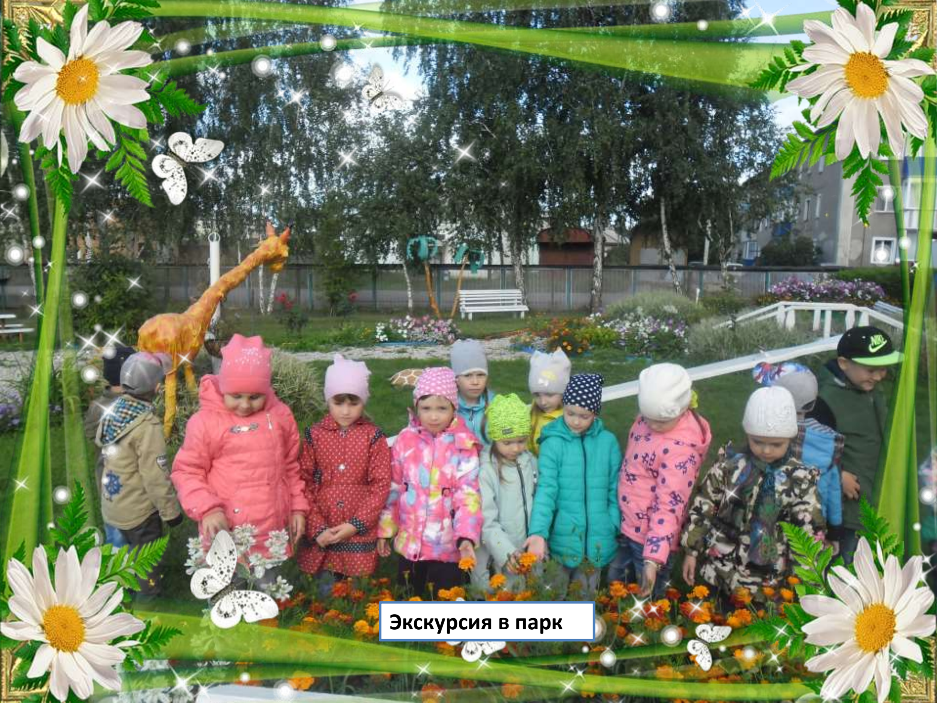
Экскурсия в парк