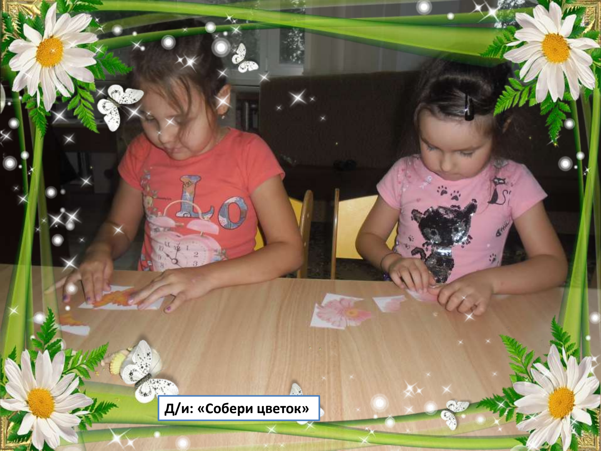
Д/и: «Собери цветок»