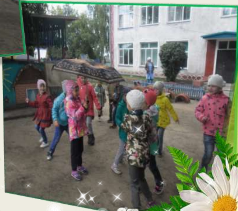
П/и: «Солнышко и дождик»