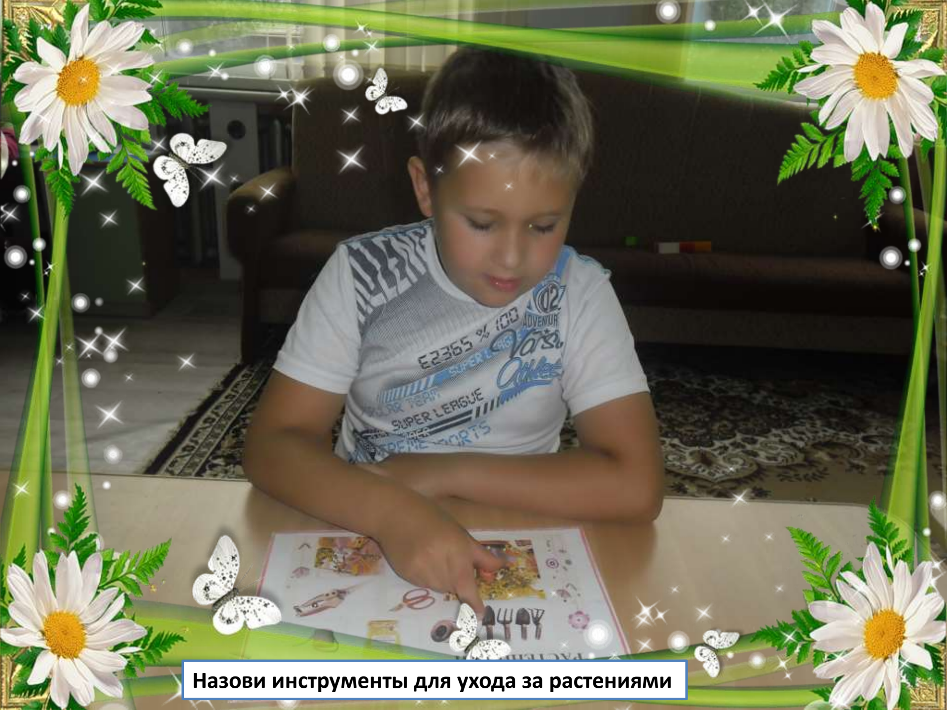
Назови инструменты для ухода за растениями